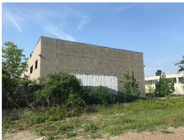
6. Lato nord