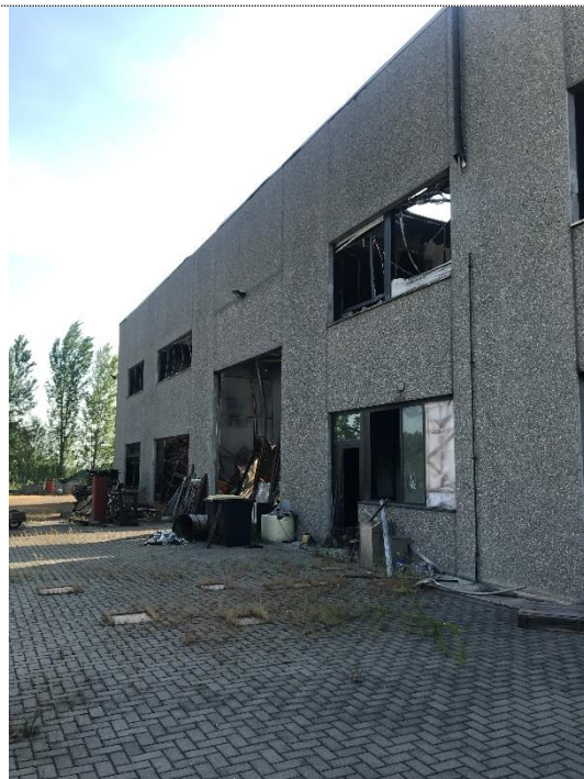
2. Lato ovest