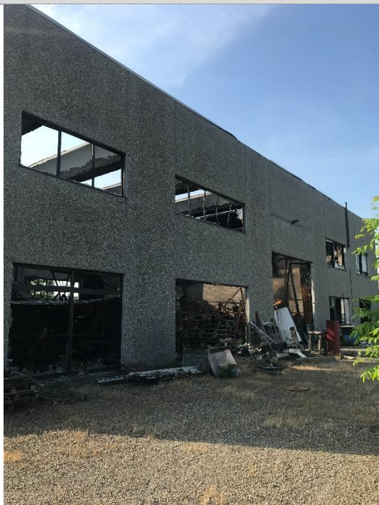
3. Lato ovest