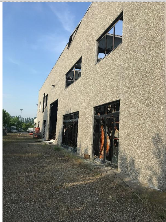
4. Lato est