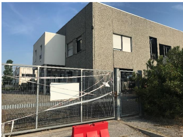
1. Accesso lato est