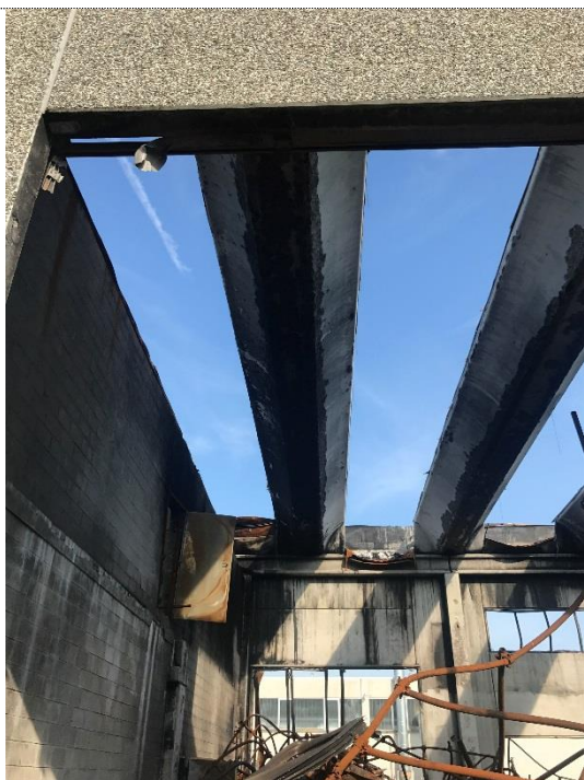
5. Zoom interni